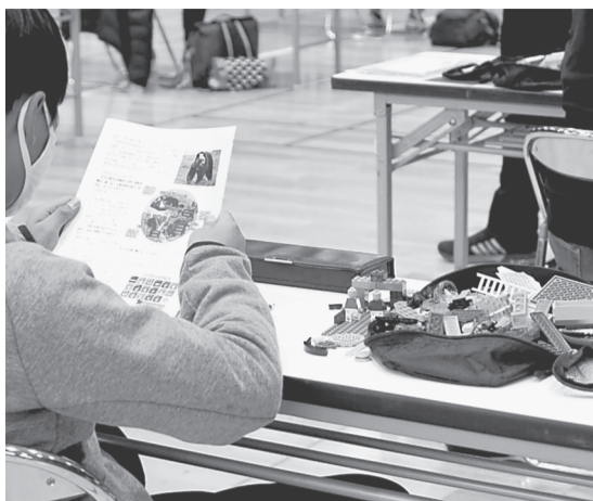
レゴブロックを使った「ものづくり思考力入試」に臨む受験生—東京都北区の聖学院中学校で2021年2月